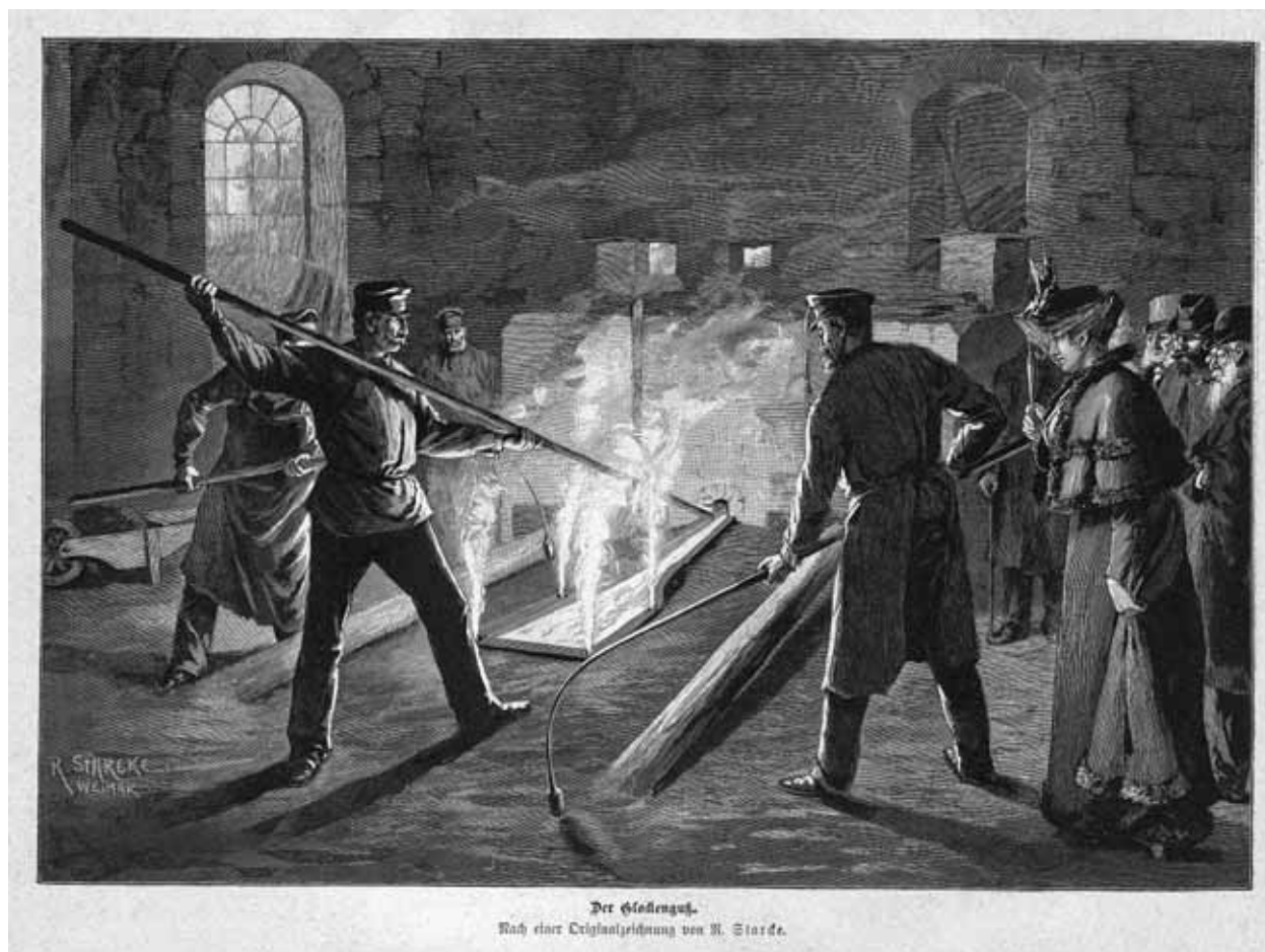
Een 19de-eeuwse klokkengieterij. Bezoekers kijken toe. (uit een onbekend Duits tijdschrift)